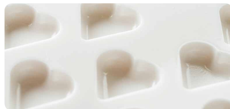
Formati a perfezione: i nostri innovativi nastri in silicone offrono un'ampia gamma di possibilità per disegni creativi dei prodotti