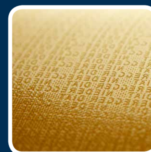
Disponibili con differenti finiture superficiali, sia lisce che in rilievo con loghi e marchi aziendali