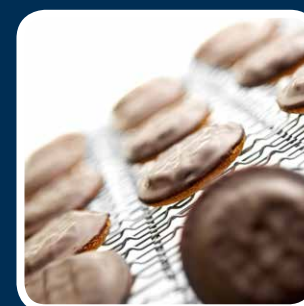
Soluzioni personalizzate con punte, alette e cunei.