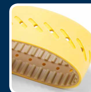
Disponibile anche per tutte le comuni confezionatrici a sacco tubolare.