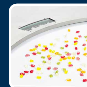
Soluzioni ottimizzate per tutte le vostre applicazioni.