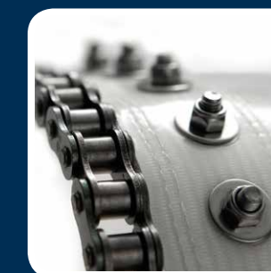
Guidati, renge di separazione fino al 30 %.