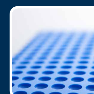
Interessante alternativa al sistema mogul.