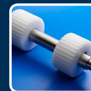
Perfettamente adatti alle nostre specifiche dei nastri.